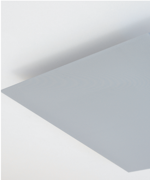
Abmessungen (in mm) Sondergrößen auf Anfrage